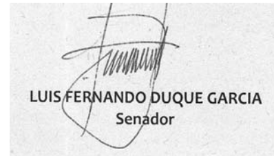
LUIS FERNANDO DUQUE GARCIA Senador

Por consiguiente, solicito a la Comisión Cuarta Constitucional Permanente del Senado de la República, dar primer debate y aprobar el Proyecto de ley número 142 de 2016 Senado, 100 de 2014 Cámara, por medio de la cual la Nación se vincula a la celebración de los setenta (70) años de existencia de la Universidad de Caldas y se autoriza en su homenaje la financiación del Centro Cultural Universitario en sus etapas II y III.